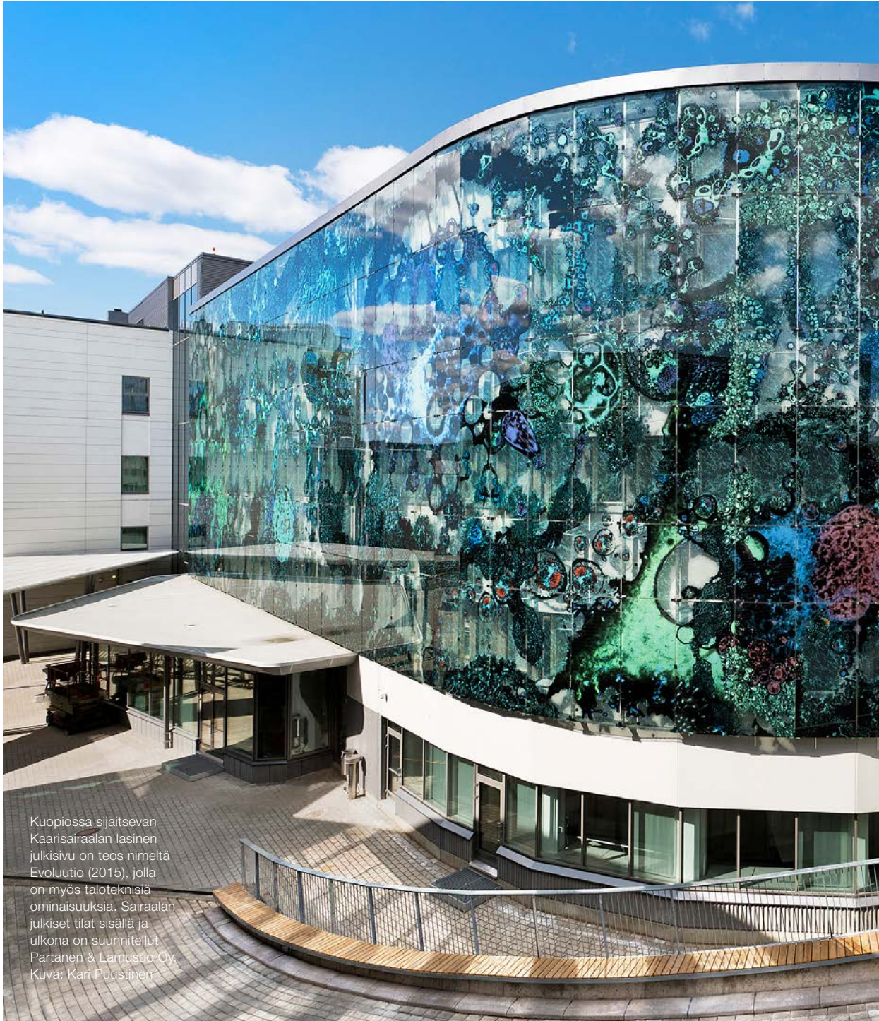
Kuopiossa sijaitsevan Kaarisairaalan lasinen julkisivu on teos nimeltä Evoluutio (2015), jolla on myös taloteknisiä ominaisuuksia. Sairaalan julkiset tilat sisällä ja ulkona on suunnitellut Partanen & Lamusuo Oy.